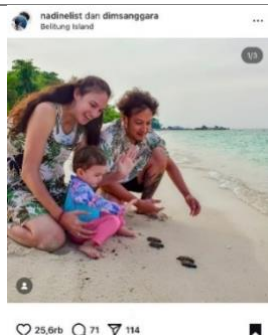
Gambar 1. Visual postingan foto pelestarian hewan laut

nadelist 🌊 Selain fakta penyu sisik, si penyu pengembara yang terancam punah, Kenapa trip ini kami sempiln kegiatan melepaskan tukik? Ya, selain Djiwa suka ma boneka tukik, pajangan tukik dan Moana, dia sempat liat cuplikan film Moana bagian membantu tukik untuk ke laut, dari sini, dia mulai bisa membedakan antara Tukik dan Penyu, dengan panggil "na.. na.. (Moana), kik.. kik.. (Tukik), nyu..nyu.. (Penyu). Akhirnya kuputusan mempertemukan Djiwa dengan tukik. Dan reaksinya, dia terpana 🤩 Disini dia belajar bgmn cara megang, cara melepaskan, alasan harus dilepas sampai berbagai ancaman bagi si penyu untuk bertahan hidup. Tidak pernah salah memperkenalkan sejak dini, apalagi dengan jejak digital seperti ini, kelak, kalau kami tak sempat menjelaskan kenapa harus bijak sama binatang alam, setidaknya Djiwa bisa mengingat kembali kegiatan sederhana jaga keseimbangan alam 🌿 #ND #langkahND #seasoldierjunior #seasoldier #NDA July 31, 2023 · See translation