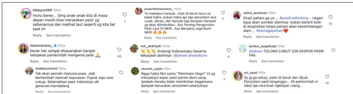
Gambar 12. Komentar pada postingan kritik pencurian pasir laut

Dalam postingan tersebut, pembaca diposisikan sebagai aktor aktif yang diajak untuk berpartisipasi dalam negosiasi makna serta terlibat secara emosional dan intelektual dengan narasi yang disampaikan. Pembaca secara langsung diajak mengkritisi tindakan eksploitasi lingkungan, terutama pencurian pasir pantai. Posisi pembaca juga bisa terlihat dari komentar-komentar yang muncul pada postingan tersebut, selain wacana yang dibangun oleh Nadine.