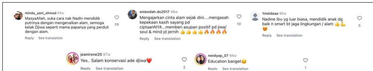
Gambar 3. Komentar pada postingan pelestarian hewan laut

Dalam postingan tersebut, pembaca ditempatkan sebagai pihak yang aktif dan partisipatif, sejalan dengan analisis wacana Sara Mills yang menekankan pentingnya peran pembaca dalam membentuk makna serta respon terhadap teks. Selain wacana yang dikembangkan oleh Nadine, posisi pembaca juga dapat terlihat dari komentar-komentar yang diberikan pada postingan tentang pelepasan tukik tersebut.