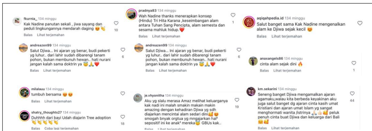
Gambar 9. Komentar pada postingan penanaman pohon sawo kecil

Pembaca dalam postingan ini diposisikan sebagai mitra aktif yang ikut menafsirkan dan memahami makna teks. Pembaca tidak sekadar penerima pasif, melainkan diajak untuk mengidentifikasi diri dengan subjek utama, yaitu ibu yang berperan aktif dalam pelestarian lingkungan, sehingga tercipta keterlibatan emosional dan moral. Posisi pembaca juga tercermin dari komentar-komentar yang muncul di postingan tersebut, selain dari wacana yang disampaikan oleh Nadine.