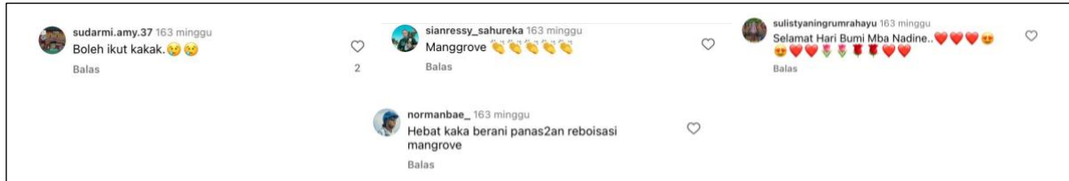
Gambar 6. Komentar pada postingan penanaman mangrove

Dalam postingan tersebut, pembaca ditempatkan sebagai pihak yang aktif dan reflektif, sejalan dengan analisis wacana Sara Mills yang menekankan pentingnya peran pembaca dalam membentuk makna serta respon terhadap teks. Selain wacana yang dikembangkan oleh Nadine, posisi pembaca juga dapat terlihat dari komentar-komentar yang diberikan pada postingan tentang pelepasan tukik tersebut.