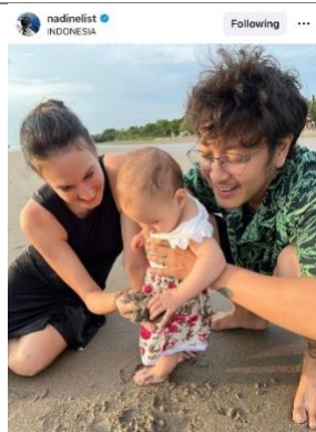
Gambar 10. Visual postingan foto kritik pencurian pasir laut

nadelist Tenang kok, pasir kita banyak, tak mungkin 'berasa' kekurangan. Hmm... harus sampai hilang dulu, baru berasa kehilangan ya? Oh no, Djwa dan teman2 semakin sulit nanti main pasir dan jangan-jangan kalau sudah besar, pas diving sepi lagi di bawah lautnya 🙄 Pasir itu ya sama kayak tanah. Ada fungsinya untuk manusia. Tanah pasir mah ngak butuh manusia tuk hidup, wong kita yang butuh untuk kenyamanan hidup. Ekosistem pesisir terdiri dari tiga komponen utama: mangrove, terumbu karang, dan padang lamun Lamun bisa mengolah karbon dioksida menjadi energi dalam bentuk biomassa. Biomassa ini akan dimanfaatkan oleh biota laut. Padang lamun penting bgt jadi sumber makanan bagi biota laut, seperti ikan duyung, penyu hijau, dan kawan2nya 🐟 Padang lamun tumbuh menjadi pendamping terumbu karang dan mangrove. Otomatis jadi rumah bagi hewan kecil seperti kepiting, udang, ikan2 kecil, sampai kuda laut. Pasir diambil terus? Ya otomatis juga jadi ancaman pulau kecil serta wilayah dan masyarakat pesisir 🙄 Belum telat untuk memperingati hari laut sedunia hari ini, karena memang harus selalu diingatkan terus dan terus demi keseimbangan alam. #happyoceansday #seasoldier June 8, 2023 · See translation